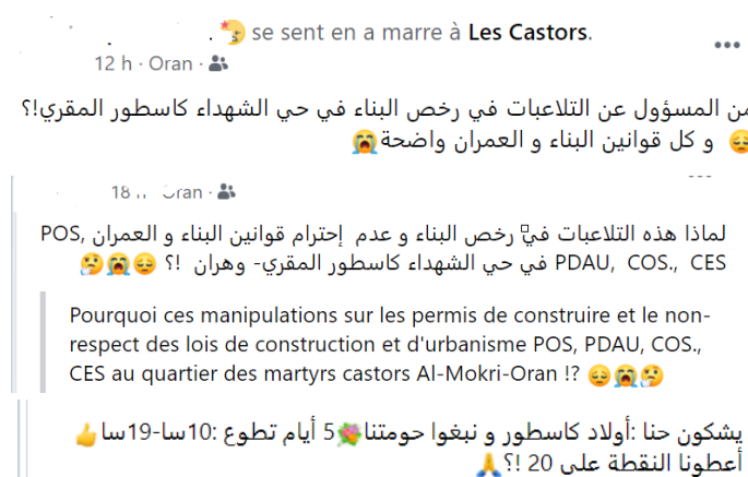
Figure 2 : Extraits de la page Facebook du vice-président du comité de quartier les Castors Jourdain Oran

L'attachement des habitants des Castors à leur quartier se lit à travers leur visibilité sur Facebook, il y a au moins deux pages dédiées au quartier « OULED Castors Oran 31 » et « les Castors Oran » en plus de la page personnelle du vice-président du comité. Ce dernier en fait un espace virtuel d'information et de promotion de son quartier et en même temps de la destination Algérie avec un slogan en arabe نحوس بلادي و نخوي راسي (je visite mon pays et je vide ma tête). Le dynamisme du comité de quartier les Castors est largement tributaire de ce vice-président qui diversifie les actions et les réactions. Ses dénonciations se font sans affrontements. Lors de nos entretiens, il a déclaré avoir de bonnes relations avec tout le monde y compris la mairie qui passe sous silence les infractions constatées. Il estime que le quartier a besoin de toutes les aides et les bonnes volontés même de ceux qui ont contribué à le défigurer, « Nous n'œuvrons pas pour les coups partis, mais nous les pointons du doigt pour empêcher que les mêmes erreurs soient commises.