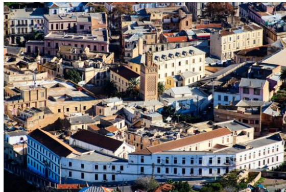
Figure 2 : Le secteur sauvegardé de Sidi El Houari. Source : http://cnra.dz/atlas/secteur-sauvegarde-vieille-ville-de-sidi-el-houari

Ces situations mobilisent des associations vouées à la sauvegarde des traces du passé à l'instar des associations Delfine et les Amis de la Casbah de Dellys (ACAD) et des associations Santé Sidi el Houari et Bel Horizon à Oran. Les démarches participatives se sont déroulées dans les deux villes, selon des modalités d'organisation différentes :