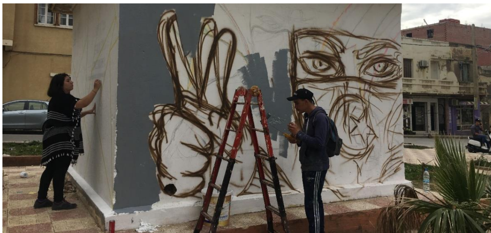
Figure 1 : Plumes urbaines portées sur l'espace public de la ville de Jijel (Khelfallah, 2019)

Ces deux teams incarnent les nouvelles actions, créations, démarches et stratégies urbaines inconscientes, logées au sein de l'espace public, détachées de tout commanditaire hiérarchique et ne subissant que leurs besoins intrinsèques « mis à jour ».