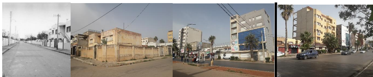
Figure1 : les Castors Jourdain Oran entre 1956 et aujourd'hui

(Source : Chachour, Belas, 2018 ; Mouaziz-Bouchentouf, 2021)