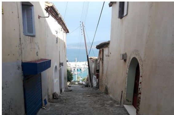
Figure 1 : Vue sur la casbah de Dellys.

Les centres historiques de Dellys et d'Oran disposent d'un riche patrimoine culturel (cf. figures 1 et 2). Ils font l'objet d'un processus de patrimonialisation en cours. Malgré leur classement, ils sont soumis à un processus de dégradation avancé.