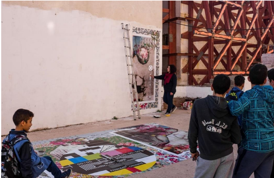
Figure 1 : Préparation du travail de Princesse Zazou.

intellectuelle, sociale et culturelle. Le fait de poser sa pensée chaotique sur un mur est déjà une harmonie accomplie avec la ville et ses habitants ».